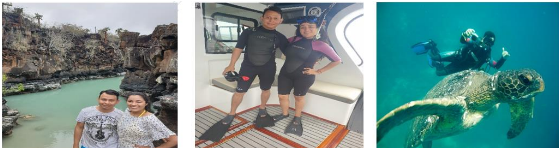
Figura 7 Visitando grietas, haciendo snorkel y buceo