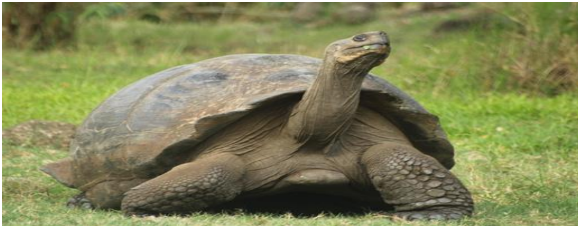
Figura 2 Tortuga Gigante George