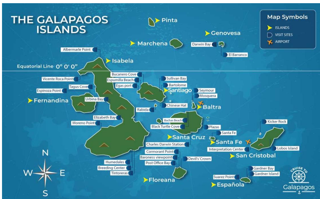
Figura 1 Islas Galápagos

Nota: Foto obtenida de: https://cruisetogalapagos.com/assets/main/galapagos-islands/galapagos-map/images/galapagos-map.jpg