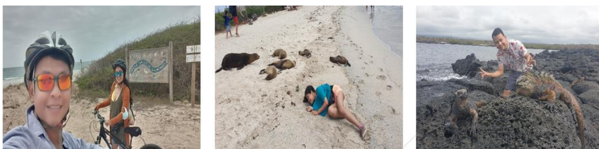
Figura 6 Interactuando con la naturaleza

Nuestro viaje a Galápagos, realizado en diciembre de 2020, a pesar de las restricciones por la pandemia, transcurrió sin contratiempos. Comenzamos nuestro viaje en Guayaquil, tomando un vuelo de Latam hacia el aeropuerto de Baltra en Galápagos y luego nos dirigimos a Santa Cruz, donde nos alojamos por 3 días. Durante nuestra estadía, conocimos lugares como Tortuga Bay, con sus dos playas: Playa Mansa, tranquila y repleta de aves e iguanas marinas, y Playa Brava, más abierta al mar y preferida por surfistas experimentados.