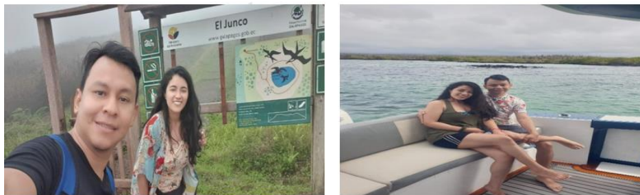
Figura 5 Uniendo corazones en el paraíso natural de las Galápagos